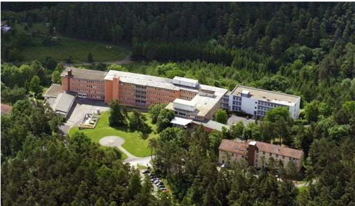
Luftbild von 1974