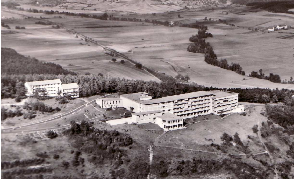
Die Klinik im Jahr 1954