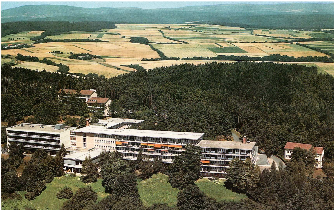
Aufnahme aus dem Jahr 1990